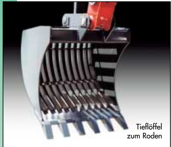
Tieflöffel zum Roden