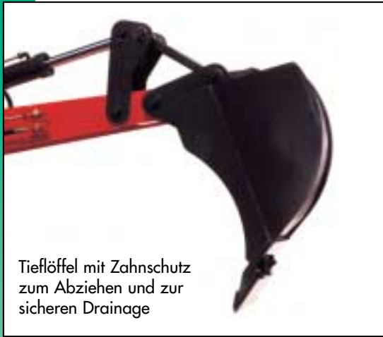
Tieflöffel mit Zahnschutz zum Abziehen und zur sicheren Drainage