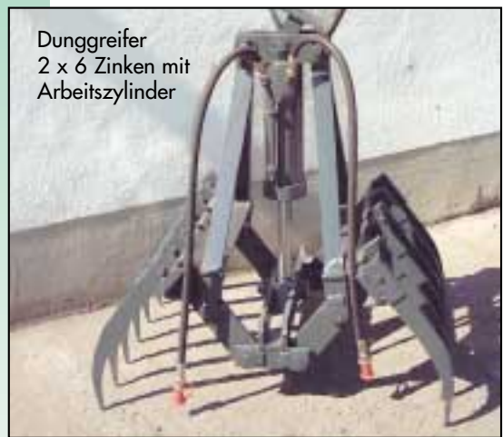
Dunggreifer 2 x 6 Zinken mit Arbeitszylinder

CE Eigene Entwicklung und Fertigung nach CE-Norm