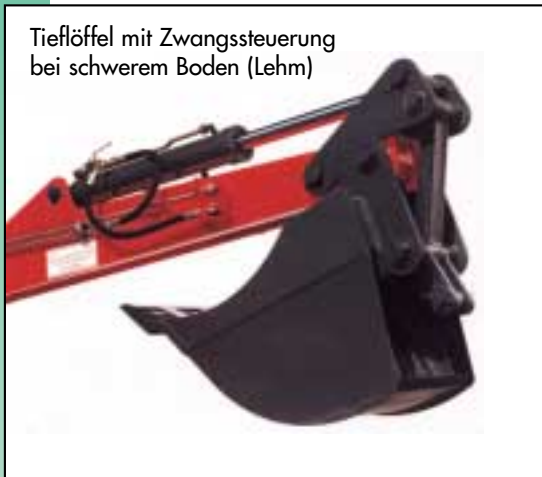
Tieflöffel mit Zwangssteuerung bei schwerem Boden (Lehm)