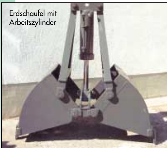
Erdschaufel mit Arbeitszylinder